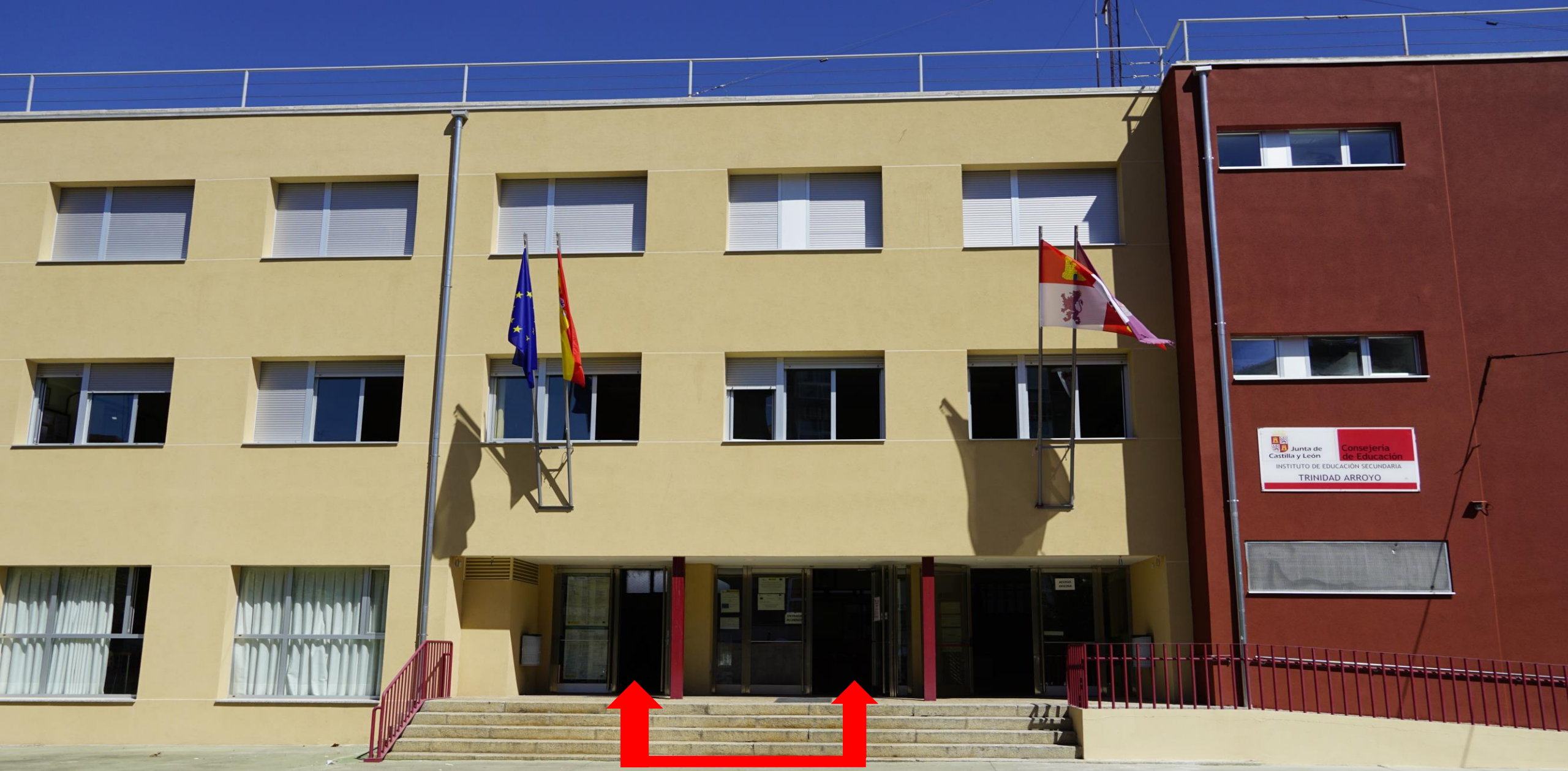
Puertas de acceso 1º planta y biblioteca