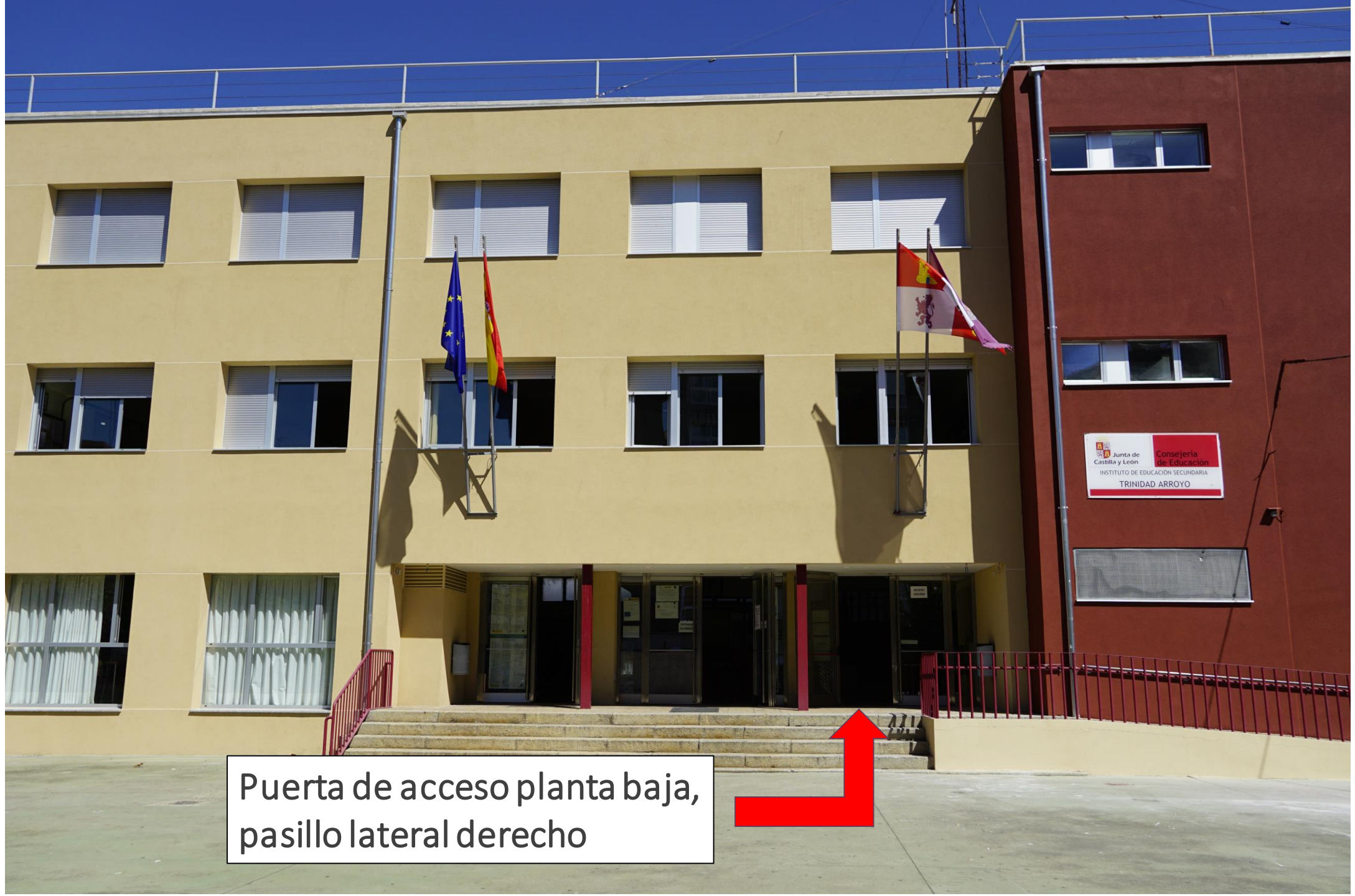
Puerta de acceso planta baja, pasillo lateral derecho